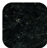
43-6036-07 Cambrian black