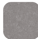
53-6036-HRU609 Uptown Grey